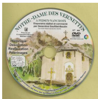
En vente aux offices de Tourisme de Peisey-Vallandry